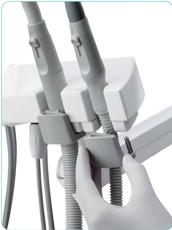
Vodila sesalnih cevi

Izvedba, ki zagotavlja udobje za zobozdravnika, ekipo v ordinaciji in za paciente. Združuje učinkovitost in enostavnost uporabe, ki zobozdravniku omogoča dan brez stresa.