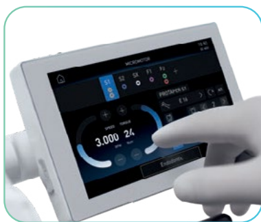
Nadgradnja s peristaltično črpalko - kirurgija

Na voljo sta verziji z zgornjimi (Continental) in spodnjimi biči (International).