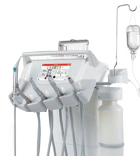
Sterilni sistem dotoka tekočin s peristaltično črpalko (opcija)