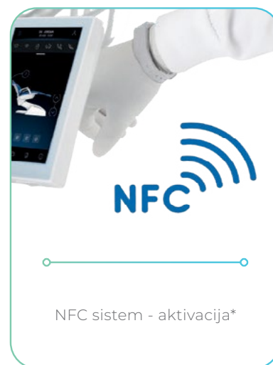
NFC sistem - aktivacija*

Na voljo v izvedbi s spodnjimi biči (International) ali zgornjimi biči (Continental), zgornji biči primerni za delo levičarjev in desničarjev, Side Delivery in Cart - novost!!!