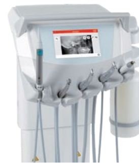
Full touch ekran za upravljanje, ki omogoča prikaz RTG posnetkov