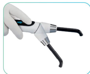
Polimerizacijska luč T-LED s prikazom programov