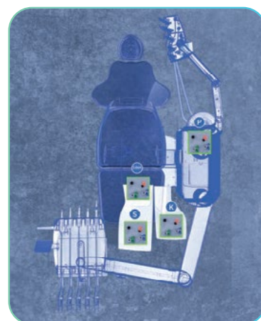
možna montaža stola brez spreminjanja obstoječih talnih instalacij, ki so bile prilagojene nekaterim drugim proizvajalcem zobozdravniških stolov