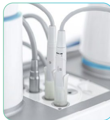
modul za dezinfekcijo cevi integriran v fontani stola

Na voljo verzije v izvedbi s spodnjimi biči (International) ali zgornjimi biči (Continental).