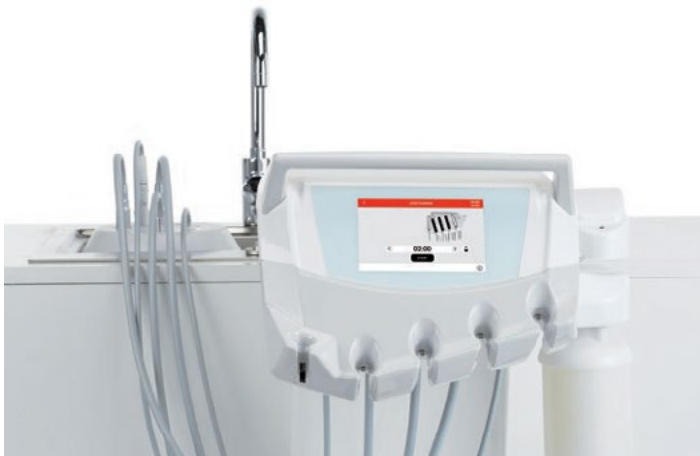
Spiranje in dezinfekcija cevi

Kirurški voziček, ki je na voljo s standardnim ali hitrim priključkom za priključno omarico, nameščeno na tleh, se lahko uporablja v več kot enem prostoru. Enostaven in varen mehanizem za priklop in odklop zobozdravnikom zagotavlja večjo organizacijsko prilagodljivost.