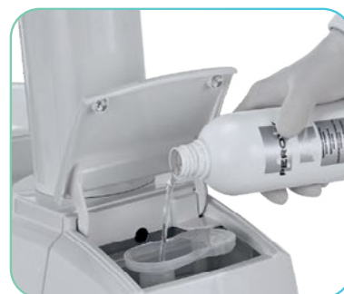
Nov način dolivanja dezinfekcijskega sredstva za cevi