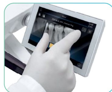
Pregled RTG posnetkov na ekranu

Na voljo v izvedbi s spodnjimi biči (International) ali zgornjimi biči (Continental).