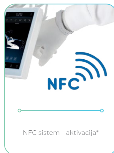
NFC sistem - aktivacija*

Na voljo v izvedbi s spodnjimi biči (International) ali zgornjimi biči (Continental), zgornji biči primerni za delo levičarjev in desničarjev, Side Delivery in Cart - novost!!!